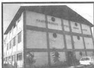
FRATERNIDADE ESPÍRITA IRMÃO GLACUS