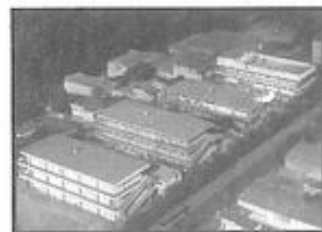
FUNDAÇÃO ESPÍRITA IRMÃO GLACUS