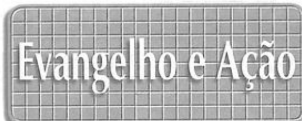
ÓRGÃO DE DIVULGAÇÃO DA FRATERNIDADE ESPÍRITA IRMÃO GLACUS • FUNDADO EM ABRIL DE 1988 RUA HENRIQUE GORCEIX, 30 • PADRE EUSTAQUIO • CEP: 38.720-360 • BELÓ HORIZONTE • MINAS GERAIS