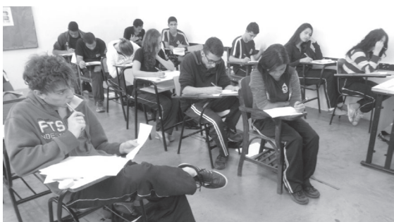
3º Simulado 2015 – preparação para o ENEM

Os alunos do ensino médio do Colégio Espírita Professor Rubens Costa Romanelli fizeram durante o ano de 2015 três simulados, cada um contendo 110 questões e redação, com temas atuais para melhor se prepararem para o ENEM.