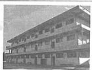
Fundação Espírita Irmão Glacus

Órgão de Divulgação da Fraternidade Espírita Irmão Glacus - Fundado em abril de 1988 Rua Henrique Gorobex, 30 - Pedre Eustáquio - CEP: 30720-360 - Belo Horizonte - MG