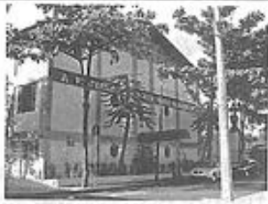
Fraternidade Espírita Irmão Glacus